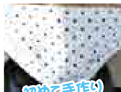
初めて手作り しました!