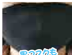
黒マスクも いいでしょ♡