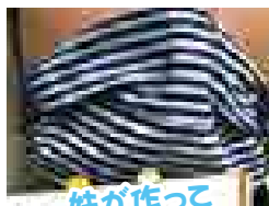
妹が作ってくれました。